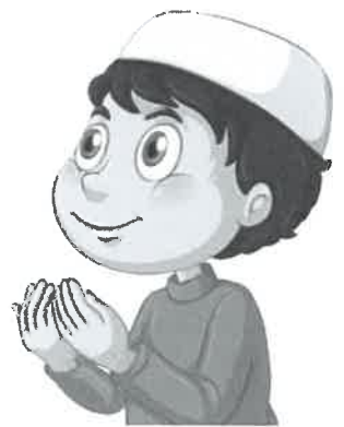
عبادة قولية ص ٨١