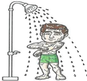
نجاسة في بدنه