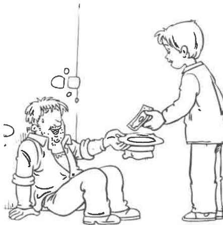
عبادة مالية ص ٨٢