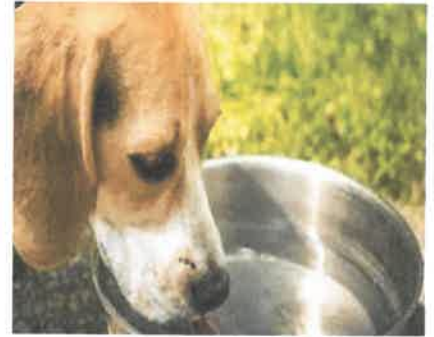
إناء وُلغ فيه الكلب

الغسل سبع مرات اولاهن بالتراب الغسل بالماء الدلك بالتراب ص ٤٨