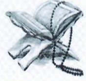
قراءة سورة الكهف