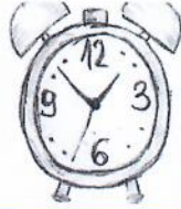
التذكير إلى الصلاة