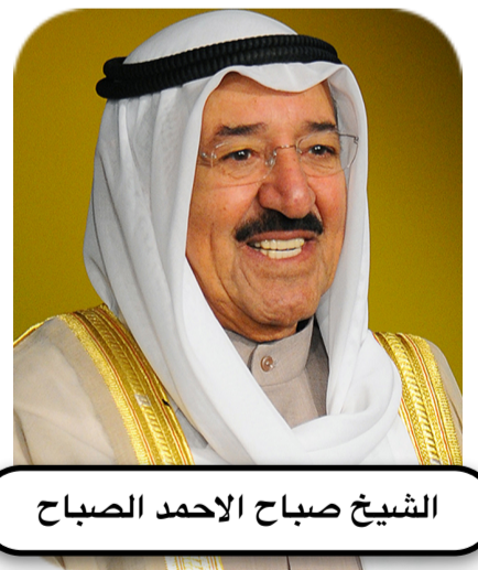
الشيخ صباح الاحمد الصباح