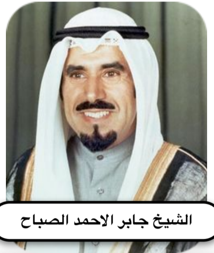
الشيخ جابر الاحمد الصباح