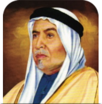
الشيخ عبدالله السالم الصباح