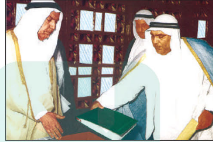
التصديق على الدستور