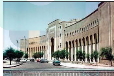
إنشاء ثانوية الشويخ