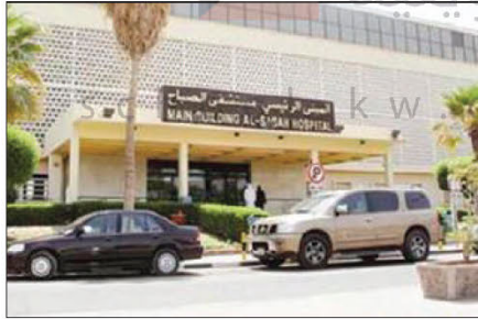
إنشاء مستشفى الصباح