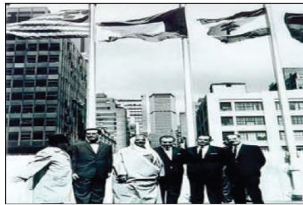
انضمام دولة الكويت للأمم المتحدة