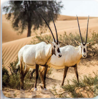
محمية دبي الصحراوية ٢٢٥ كيلومتراً مربعاً