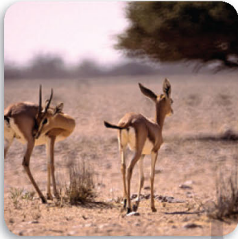
محمية السليل الطبيعية في عمان ٢٢٠ كيلومتراً مربعاً

سَوْفَ تَتَعَلَّمُ : كَيْفَ يُمَكِّنُكَ اسْتِخْدَامُ الْقِيَمَةِ الْمَكَائِنَةِ لِمُقَارَنَةِ الْأَعْدَادِ الْكُلِّيَّةِ وَالْكَسُورِ الْعَشْرِيَّةِ وَالْأَعْدَادِ الْعَشْرِيَّةِ وَتَرْتِيبِهَا.