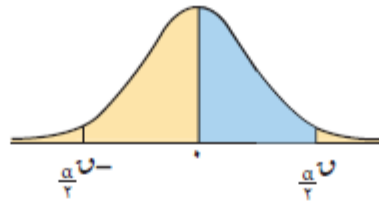
جدول التوزيع الطبيعي المعياري (u)