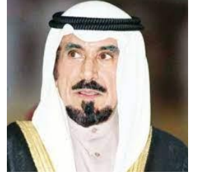
الشيخ جابر الأحمد الصباح ( أمير القلوب )