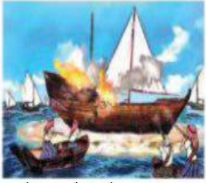
معركة الرقة البحرية في عهد الشيخ عبدالله بن صباح