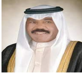
الشيخ نواف الأحمد الصباح ( حاكم دولة الكويت الحالي )