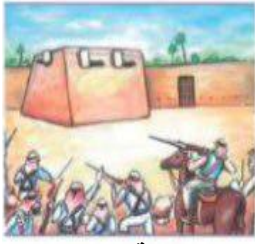
معركة الجهراء عهد الشيخ سالم المبارك