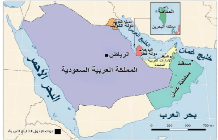
خريطة دول الخليج العربية وعواصمها

تمر دائرة مدار السرطان عبر بعض الدول الخليجية وهي: