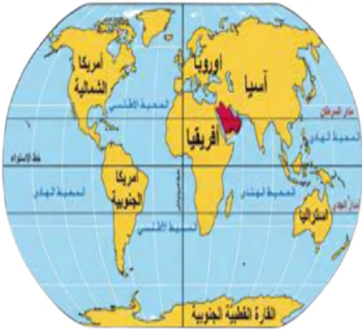
خريطة موقع منطقة دول الخليج العربية بالنسبة لقارات العالم