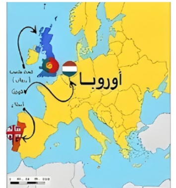
خريطة الدول الاستعمارية الأوروبية على منطقة دول الخليج العربية.