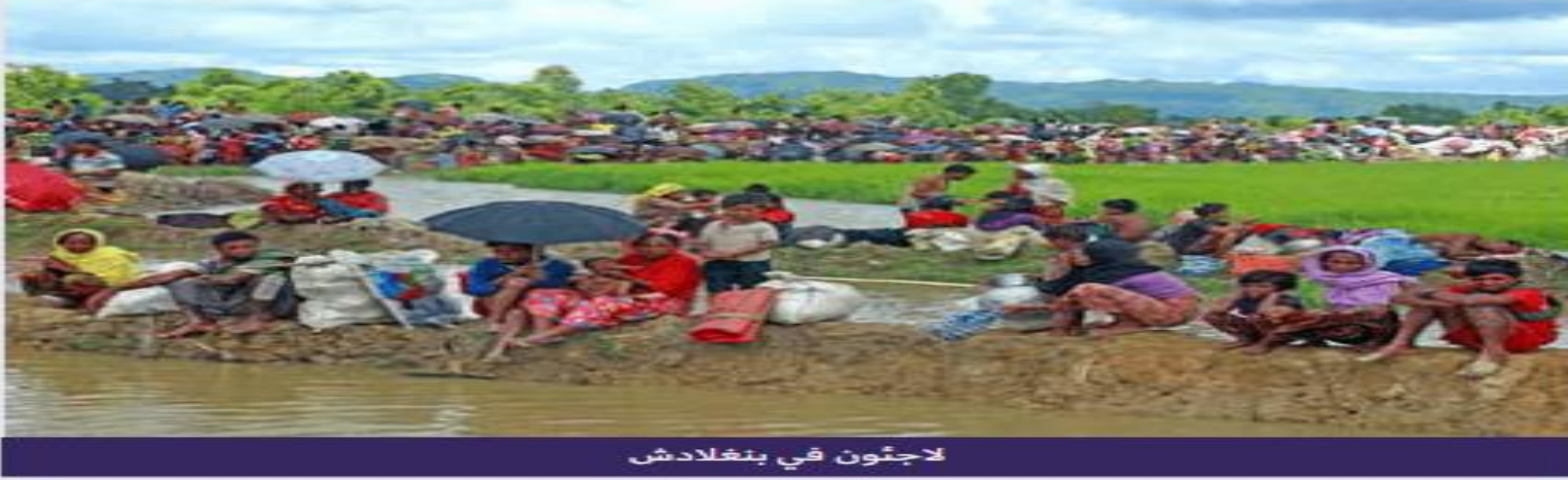
لاجئون في بنغلادش

كان صاحب السمو الشيخ محمد بن راشد آل مكتوم نائب رئيس الدولة وحاكم دبي - حفظه الله - قد أمر في السابق بانطلاق ثلاث رحلات جويّة لنقل إمدادات إنسانيّة حيويّة للاجئين في بنغلادش. يستفيد من المساعدات أكثر من 230.000 لاجئ فرّوا من الاضطهاد في دولة مجاورة. إنهم يعيشون وسط ظروف قاسية في مخيمات مؤقتة حيث يفتقرون إلى المستلزمات الأساسيّة للحياة، مثل الغذاء والماء والملبس. لقد أدّى العنف إلى نزوح حوالي 520.000 شخص خلال الشهور القليلة الماضية. هذه الرحلة هي الأخيرة ضمن سلسلة من الرحلات الجويّة الإنسانية من دبي. كان صاحب السمو الشيخ محمد بن راشد آل نهّان نائب رئيس الدولة وحاكم دبي حفظه الله قد أمر في السابق بإنشاء جسر جويّ إلى بنغلادش. وقد أدّى ذلك إلى انطلاق ست رحلات جويّة إلى دكا عاصمة بنغلادش، نقلت موادّ إغاثة بلغت 550 طنّاً متريّاً.