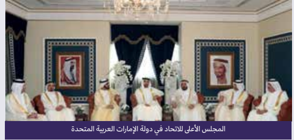
المجلس الأعلى للاتحاد في دولة الإمارات العربية المتحدة

4 شأنها شأن البلدان والدول الأخرى، تحكم دولة الإمارات العربية المتحدة بحكومة تم تشكيلها بموجب الدستور. اقرأ النص التالي عن المجلس الأعلى للاتحاد ثم أجب عن الأسئلة التالية.