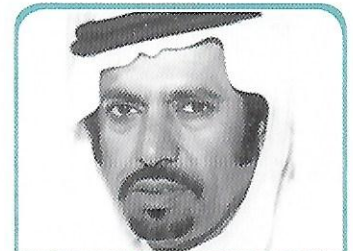
الشيخ حمدان بن محمد