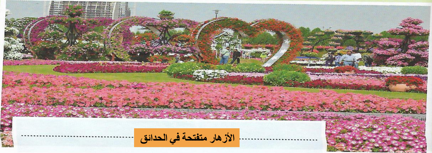
الأزهار متفتحة في الحدائق