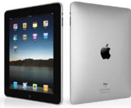
آيباد: طلب فعلي