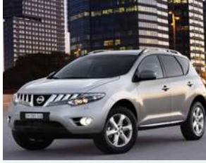
سيارة: طلب فعلي