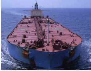
ناقلة نفط: طلب غير فعلي