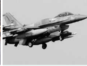
طائرة عسكرية: طلب غير فعلي