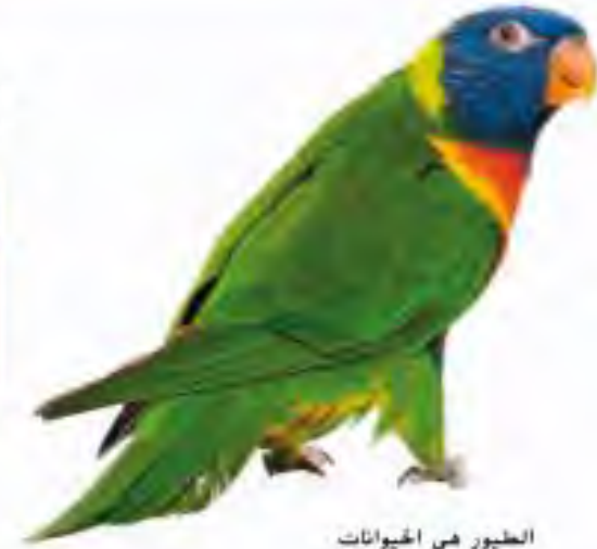
الطيور هي الحيوانات الوحيدة التي لها ريش.

لمعرفة المزيد عن كيفية طيران الطيور، أجزء التجربة السريعة في آخر الكتاب.