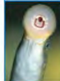
الأسماك عديمة الفك