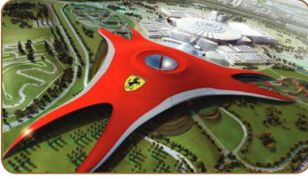
عالم فيراري في ابوظبي