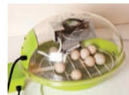
الشكل 11 تتحول الطاقة الكهربائية إلى طاقة حرارية في المصباح الحراري، وتنتقل الطاقة الحرارية من المصباح إلى الهواء الصغير.

يحوّل transform (فعل) تغيير الشكل أو البنية