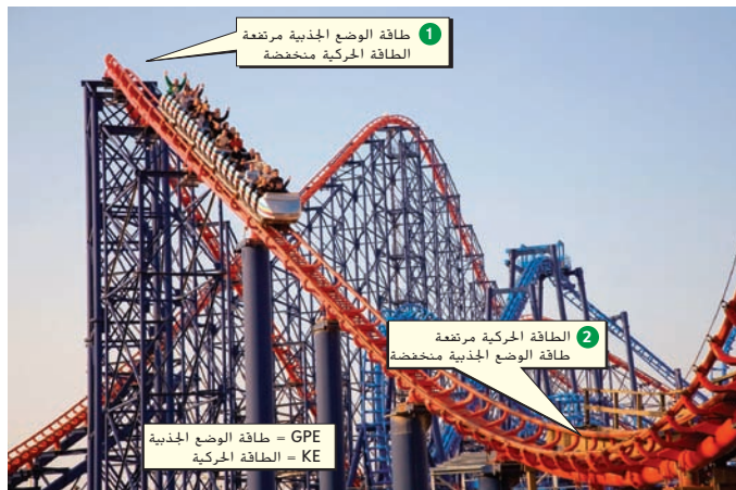
الشكل 12 أثناء ركوبك عربة أفعوانية، تتحول طاقة الوضع الجذبية لديك إلى طاقة حركية ثم تعود لتتحول إلى طاقة وضع جذبية مرة أخرى.