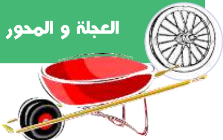
العجلة و المحور