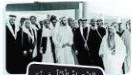
الاجتماع الأول في دبي