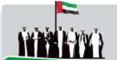
قيام دولة الإمارات العربية المتحدة في 2 من ديسمبر عام 1971 م