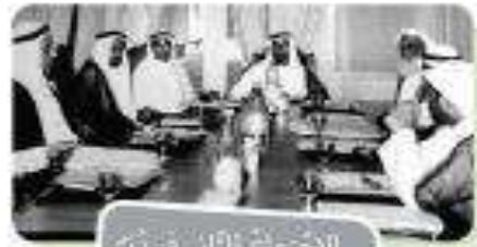
الاجتماع الثاني في دبي