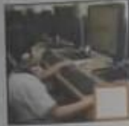
( ب ) التعليم

أولاً: 10. ضع إشارة ( ✓ ) في المربع تحت الصورة التي توضح إنجازات صاحب السمو الشيخ خليفة بن زايد آل نهيان - حفظه الله: