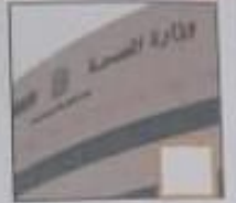
( ا ) الصحة