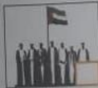
( د ) قيام الاتحاد