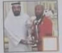
( ج ) الرياضة

ثانياً: حوِّط برسم دائرة حول الاختيار المناسب لكل عبارة مما يأتي: