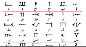
كتابة اشتهرت بها بلاد الرافدين