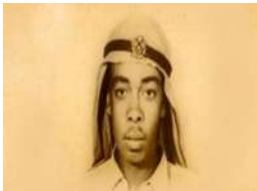
أول شهيد إماراتي؟

ثالثاً: لاحظ الصور الآتية وأجب وفقاً لما هو مطلوب تحت كل منها: