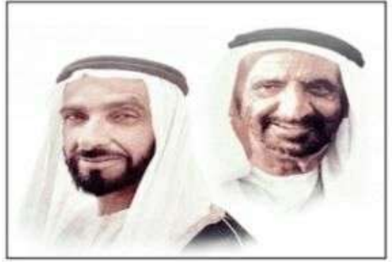
الشيخ ..... زايد الشيخ ..... راشد