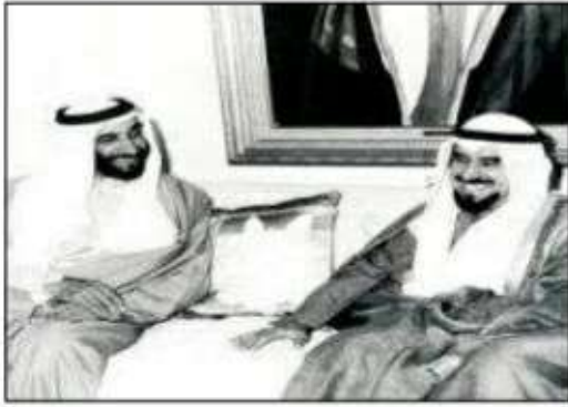
الشيخ ..... زايد الشيخ ..... جابر الاحمد الصباح