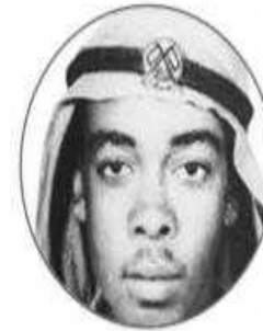
الشهيد سالم سهيل خميس

لقد كان أول الشهداء الذين رَووا بدمائهم الزكية تربة الوطن، وقبره شاهدٌ على ظلم الغزاة المعتدين، وقد أمر صاحب السمو الشيخ خليفة بن زايد آل نهيان رئيس دولة الإمارات العربية المتحدة - حفظه الله - بتحديد يوم 30 نوفمبر من كل عام يوماً رسمياً لجميع شهداء الدولة تحت مُسمى (يوم الشهيد) الذي يصادف يوم استشهاد سالم سهيل أول شهيد إماراتي.