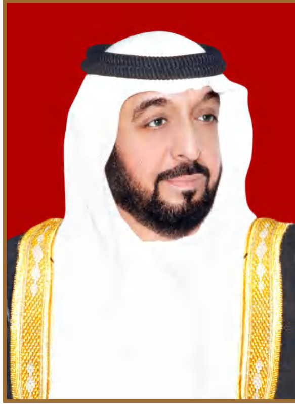
صاحب السمو الشيخ خليفة بن زايد آل نهيان رئيس دولة الإمارات العربية المتحدة، حفظه الله

” يجب التزوّد بالعلوم الحديثة والمعارف الواسعة والإقبال عليها بروح عالية ورغبة صادقة، حتى تتمكن دولة الإمارات خلال الألفية الثالثة من تحقيق نقلة حضارية واسعة.“