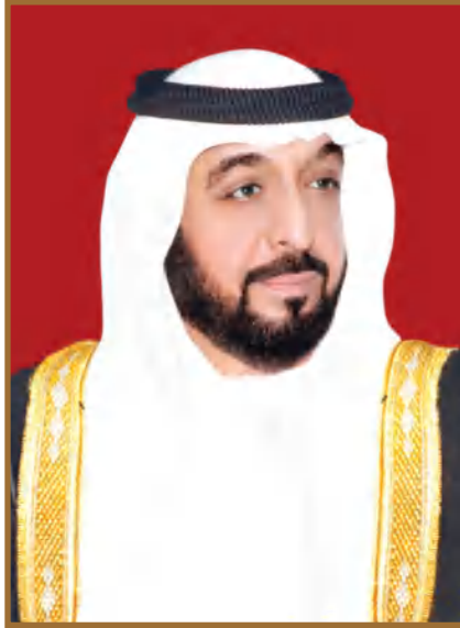
صاحب السمو الشيخ خليفة بن زايد آل نهيان رئيس دولة الإمارات العربية المتحدة، حفظه الله

"يجب التزوّد بالعلوم الحديثة والمعارف الواسعة والإقبال عليها بروح عالية ورغبة صادقة، حتى تتمكّن دولة الإمارات خلال الألفية الثالثة من تحقيق نقلة حضارية واسعة."