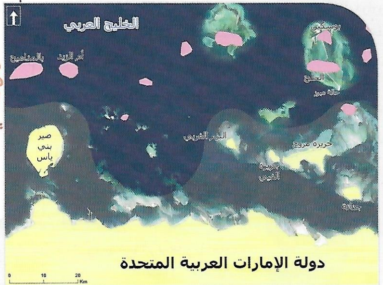
دولة الإمارات العربية المتحدة