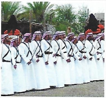
ممارسة الفنون الشعبية ( العيالة - اللبوا )