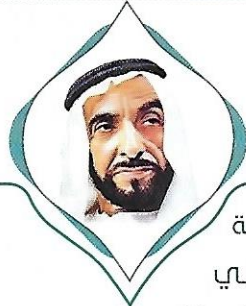
رجل بنى أمة

إن الجيل الجديد يجب أن يعرف كم قاسى الجيل الذي سبقه؛ لأن ذلك يزيده صلابة وصبراً وجهاداً لمواصلة المسيرة التي بدأها الآباء والأجداد، وهي المسيرة التي جسدت في النهاية الأمانى القومية بعد فترة طويلة من المعاناة ضد التجزئة والتفكك والحرمان.