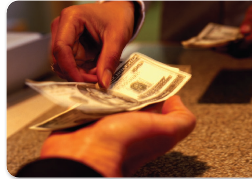
الشكل 6 يحمل العديد من الأفراد والأعمال التجارية على رأس المال من البنوك وشركات الاستثمار.

ومع ذلك، فإن إتمام المبالغ الكبيرة لا يضمن النجاح، ولتحقيق الربح، يجب أن يكون