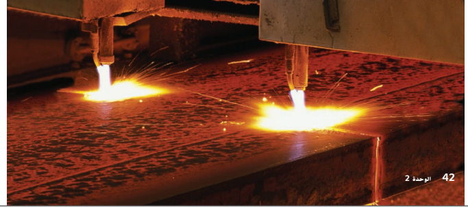
الشكل 1 يتم استخدام شتلتي لحم لتقطيع اللوح فولاذي.