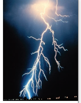
الشكل 7 درجة حرارة صاعقة البرق تبلغ خمسة أضعاف سخونة سطح الشمس.

لا تخرج الطاقة من الطبيعة عادة في صورة يستطيع الإنسان استخدامها بشكل مباشر، فعلى سبيل المثال، الفحم من مصادر الطاقة ولكن يجب معالجته، لذا، نتيج لنا التكنولوجيا إمكانيات المتور على الطاقة في الفحم وإطلاقها ثم استخدامها في أعمالنا. تبحث التكنولوجيا دائماً عن طرق جديدة وأفضل لاستخدام موارد الطاقة.