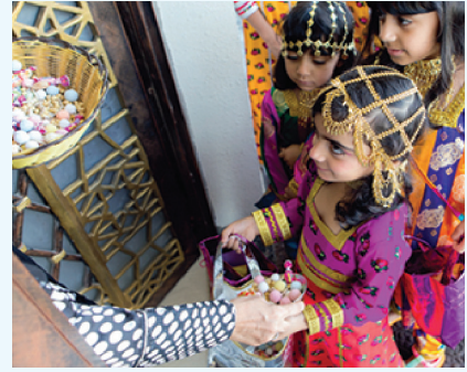
العيدية (حق الليلة)