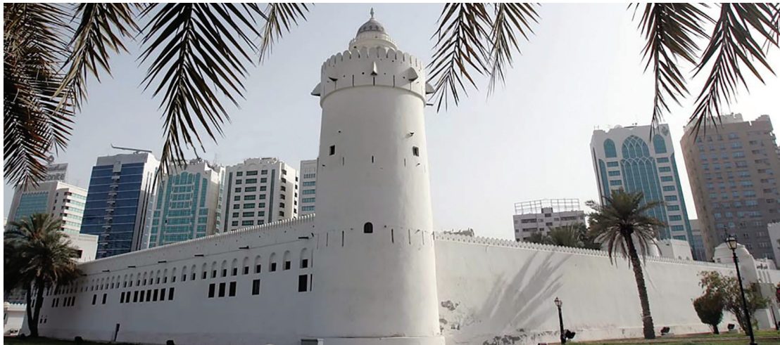
قصر الحصن - أبوظبي

واليوم تزايد الاهتمام العالمي بالتراث الشعبي. وهذا ما نلاحظه نحن في دولة الإمارات العربية المتحدة من خلال تنفيذ وإقامة العديد من الفعاليات التراثية المختلفة على مدار العام. مثل: مهرجان قصر الحصن الذي يُقام في إمارة أبوظبي، تحت رعاية صاحب السمو الشيخ محمد بن زايد آل نهيان، ولي عهد أبوظبي نائب القائد الأعلى للقوات المسلحة - حفظه الله - وبتنظيم من هيئة أبوظبي للسياحة والثقافة.