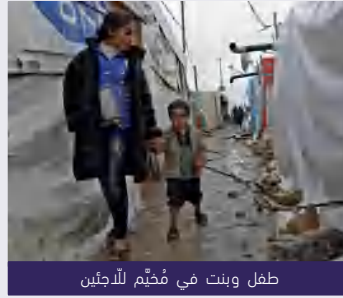
طفل و بنت في مُخيم للاجئين

يعاني العديد من الأطفال اللاجئين أوضاعًا صعبةً في كلّ من الدّول حيث نزح هؤلاء الأطفال من بلادهم بسبب الأحداث المؤسفة وتركوا منازلهم ومدارسهم، وهم يحتاجون إلى دعم نفسي يخفّف عنهم آلامهم، كما يحتاجون إلى التعليم كي لا يخسروا مستقبلهم.