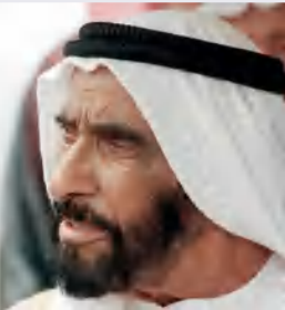
الشيخ زايد بن سلطان آل نهيان - رحمه الله، رئيس الدولة وحاكم إمارة أبوظبي سابقاً ومؤسس دولة الإمارات العربية المتحدة (1918-2004)

"إنّ الإنسان هو أساس أيّة عمليّة حضاريّة. اهتمامنا بالإنسان ضروريّ لأنّه محور كلّ تقدّم حقيقيّ مستمرّ... مهما أقمنا من مبان ومنشآت ومدارس ومستشفيات... ومهما مددنا من جسور وأقمنا من زينات، فإنّ ذلك كلّهُ يظلّ كياناً مادّياً لا روح فيه... ويبقى غير قادر على الاستمرار. إنّ الإنسان هو روح كلّ ذلك؛ الإنسان القادر بفكره والقادر بفنّه وإمكاناته على صيانة كلّ هذه المنشآت والتقدّم بها والنموّ معها".