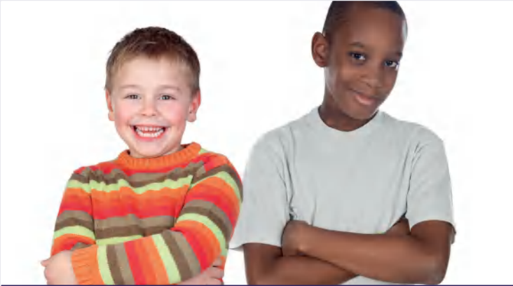
عام 1982، جنوب أفريقيا، كيب تاون، طفلان من عرقين مختلفين شكّلا صداقة في عهد الفصل العنصري في جنوب أفريقيا، حيث حرم الإنسان الأسود من أبسط حقوقه بما في ذلك الحقوق السياسية.

تلتزم الأمم المتحدة بدعم التسامح من خلال تعزيز التفاهم المتبادل بين الثقافات والشعوب. ويكمن هذا المفهوم في جوهر ميثاق الأمم المتحدة، وكذلك في الإعلان العالمي لحقوق الإنسان، وهو أكثر أهمية الآن من أي وقت مضى، خصوصاً في هذه الحقبة التي تشهد تنامي التطرف العنيف واتساع الصراعات التي تتجاهل الحياة البشرية. في العام 1996 دعت الجمعية العامة للأمم المتحدة الدول الأعضاء إلى الاحتفال باليوم العالمي للتسامح في 16 نوفمبر، من خلال القيام بأنشطة ملائمة تتوجّه نحو كل من المؤسسات التعليمية وعمامة الجمهور.