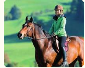
فتاة تزكّب الخيل