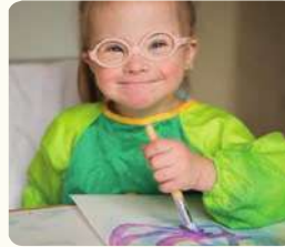
فتاة ترسم لوحة