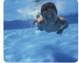
ولّد يمارسه رياضة السباحة