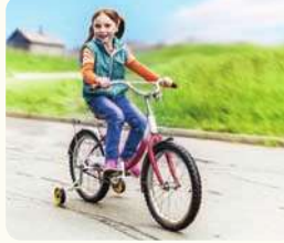
فتاة تزكّب دراجة