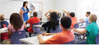
الفئة المجتمعية والعلاقات بين أفرادها: