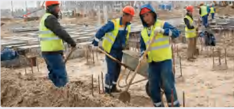
الفئة المجتمعية والعلاقات بين أفرادها: