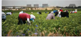
الفئة المجتمعية والعلاقات بين أفرادها: