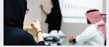
الفئة المجتمعية والعلاقات بين أفرادها:

ب. بناءً على ما اكتشفته في القسم الأول من النشاط عن الأنواع المختلفة للفئات الاجتماعية وطبيعة العلاقة التي تربط بين أفرادها، اكتب في الخانات أدناه أسماء بعض الفئات الاجتماعية التي تنتمي إليها وحدد نوع العلاقة بينك وبين كل منها، ثم اكتب اسم الفئة الاجتماعية الكبرى التي تتكون من هذه الفئات.