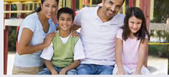
الفئة المجتمعية والعلاقات بين أفرادها: