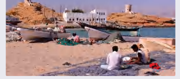
الفئة المجتمعية والعلاقات بين أفرادها: