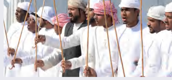
الفئة المجتمعية والعلاقات بين أفرادها: