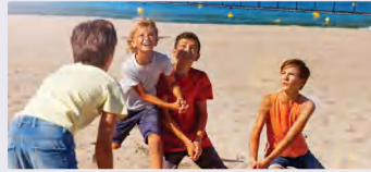
الفئة المجتمعية والعلاقات بين أفرادها: