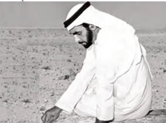
الشَّيْخُ زَايِدُ بْنُ سُلْطَانَ آلِ نَهْيَانَ - رَحِمَهُ اللهُ.

الكَلِمَاتُ الْمُسَاعِدَةُ أَبُو ظَبْيٍ - زَايِدٌ - الْوَحْدَةُ - الطَّرِيقُ