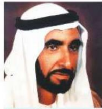
الباقي المؤسس الشيخ زايد بن سلطان آل نهيان - رَحِمَهُ اللهُ.

كان المغفور له - بإذن الله - الشيخ زايد بن سلطان آل نهيان - رَحِمَهُ اللهُ - يقود سيارته بنفسه، ويتجول في شوارع أبوظبي، ويتفقد أعمال الإنشاءات وأحوال المواطنين، ولا يرفع على السيارة العلم الرئاسي كما هو معتاد من قبل رؤساء الدول، ولم تكن أمام سيارته ولا خلفها سيارات الجراسة، بل كان - رَحِمَهُ اللهُ - يتوقَّف عند إشارات المرور كما يقتضي النظام المروري، وكثيراً ما كان سائقو السيارات يُفاجئون بأن من يتوقَّف عند الإشارة على يمينهم أو يسارهم هو رئيس الدولة.