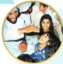
المغفور له - ياذن الله - الشيخ زايد بن سلطان آل نهيان - رحمه الله.