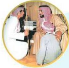
المغفور له - ياذن الله - الشيخ زايد بن سلطان آل نهيان - رحمه الله.

كَانَ يَحْلُو لِلْمَغْفُورِ لَهُ - ياذن الله - الشَّيْخُ زَايِدُ بْنُ سُلْطَانَ آلِ نَهْيَانَ - رَحْمَةُ اللَّهِ - الشَّيْزُ فِي شُورَاعِ مَدِينَةِ الْعَيْنِ الَّتِي أَحْتَبَاهَا، وَمَنْحَهَا مِنْ قَلْبِهِ ووجدانيه الكثير، ففي ذات يوم توجه بموكبه إلى السوق، وأخذ الناس يتراكمون، وبدأت السيارات تتوقف في مكانها وسط الطرقات، وإذ به - رَحْمَةُ اللَّهِ - يترجل، ويسير باتجاه أحد المحلات التجارية، وفي دقائق كان صاحب المحل يركض قادمًا ويصطحبه بعض الأشخاص، وارتقى في أحضان زايد - رَحْمَةُ اللَّهِ - والبسمة تعلو محياهما، وجلسا سوياً أمام المحل، وزايد يسأله عن أحواله وأحوال عياله، وهكذا فقد كان - رَحْمَةُ اللَّهِ - حريصاً على تفقد أحوال رعيته، ويفرح لفرحهم، ويحزن لحزنهم.