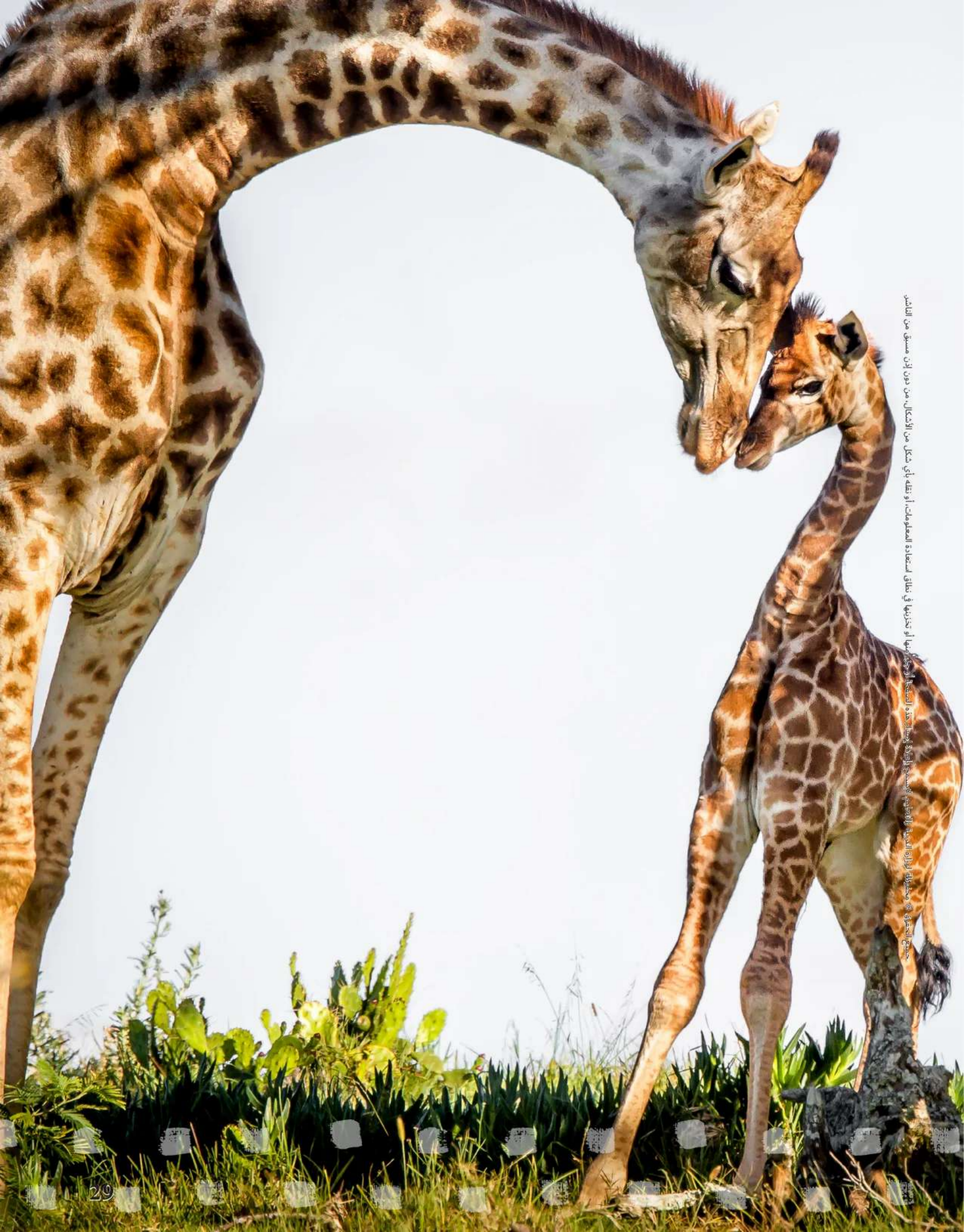
مصحف الحمرى © محفوظة لوزارة التربية والتعليم الإماراتية من أجل خدمة المجتمع أو تحفيزها أو تزيينها في نطاق استعادة المعلومات، أو نقله بأي شكل من الأشكال، من دون إذن مسبق من الناشر.